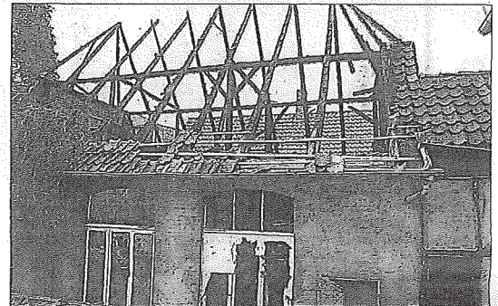
Der Dachstuhl ist verkohlt, die Zwischendecke eingestürzt.

er. Der Einsatz der Drehleitern aus Pattensen und Arnum habe sich gelohnt. Dadurch sei es gelungen, die angrenzende Pizzeria und Tischlerei zu erhalten.